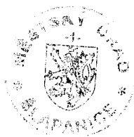
Olga Zedníčková oprávněný zaměstnanec registračního úřadu

Proti tomuto rozhodnutí se mohou ostatní volební strany, které kandidátní listinu podaly, domáhat do 2 pracovních dnů od jeho doručení ochrany u Krajského soudu v Brně (§ 59 odst. 2 zákona o volbách, za doručené se rozhodnutí považuje podle ustanovení § 23 odst. 4 zákona o volbách třetím dnem ode dne jeho vyvěšení na úřední desce obecního úřadu, který rozhodnutí vydal).