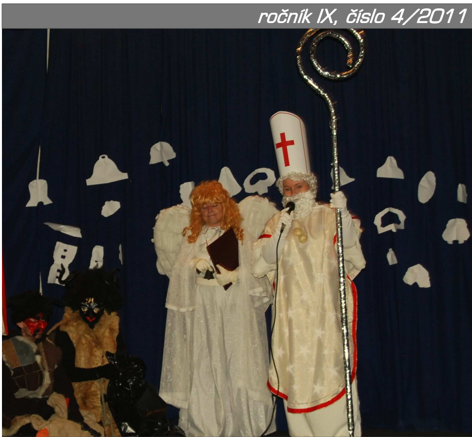
Mikulášská nadílka pro děti