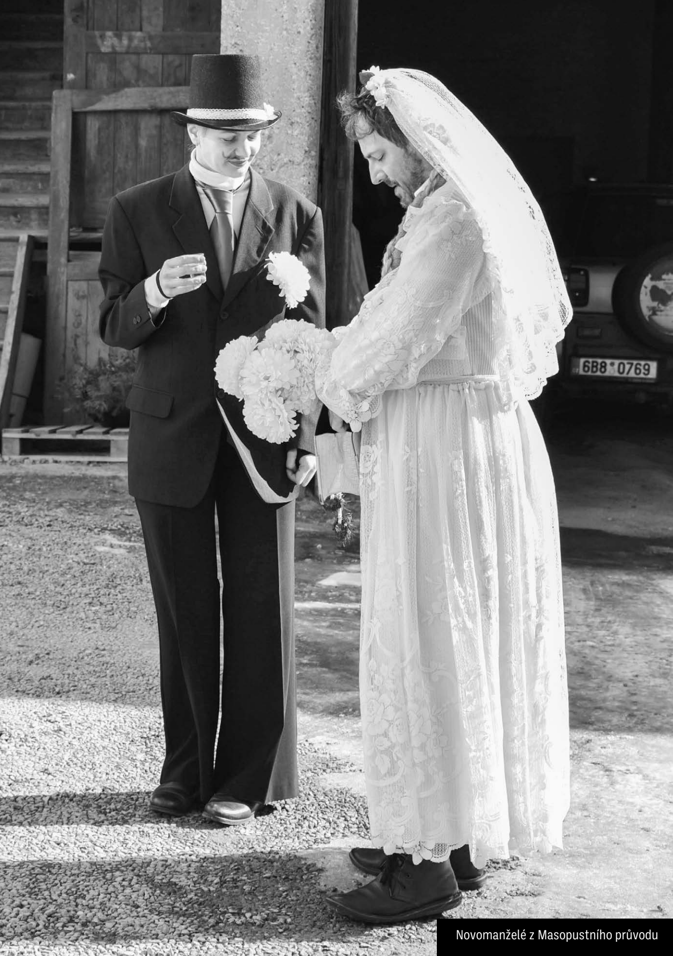
Novomanželé z Masopustního průvodu