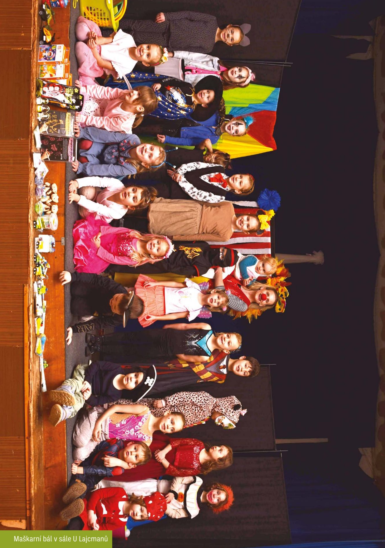
Maškarní bál v sále U Lajcmanů