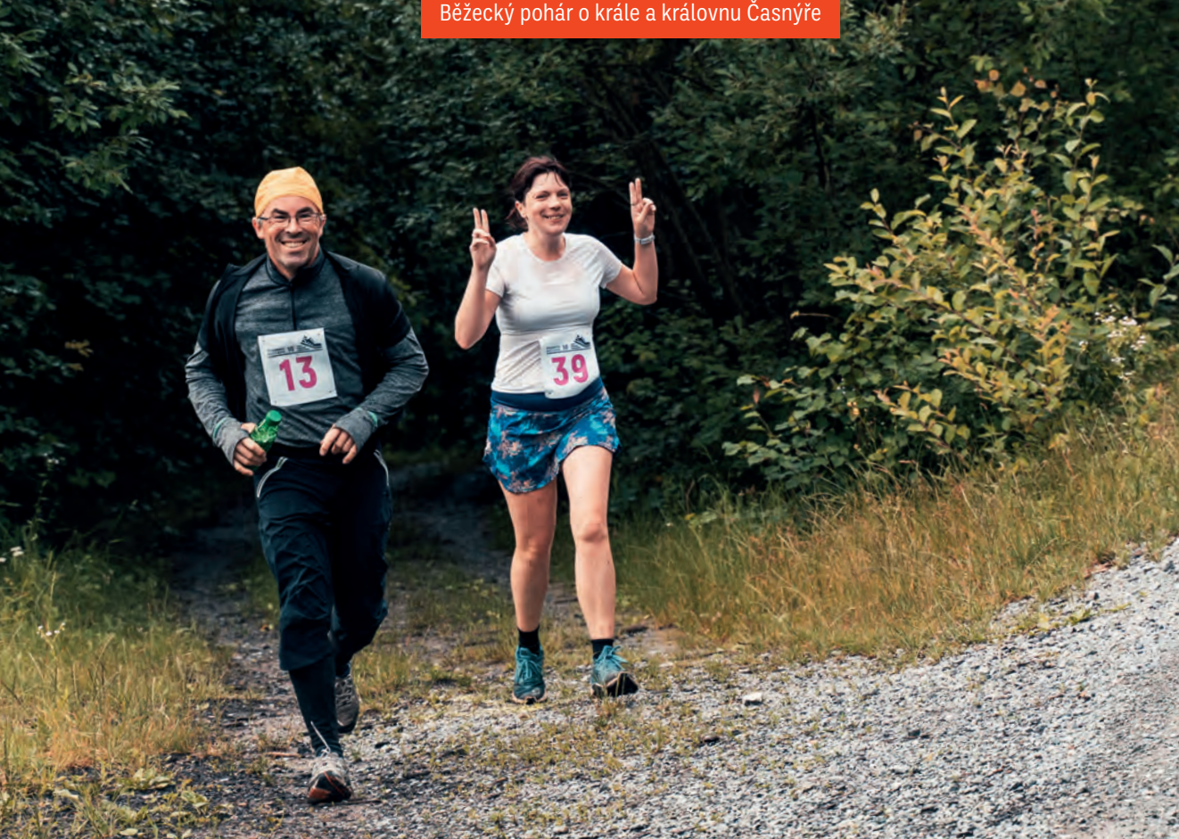
Běžecský pohár o krále a královnu Časnýře