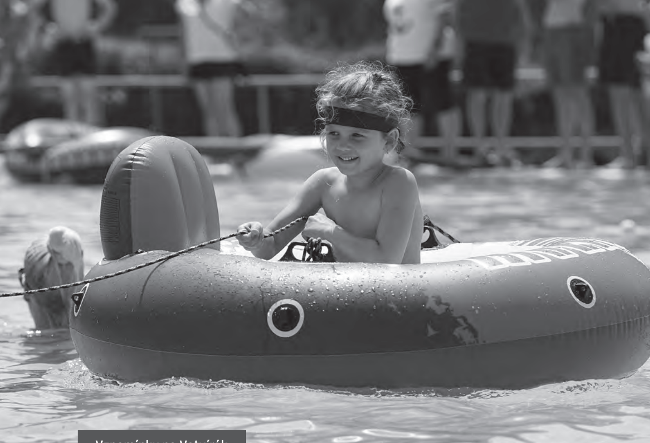
Vzpomínky na Votvírák