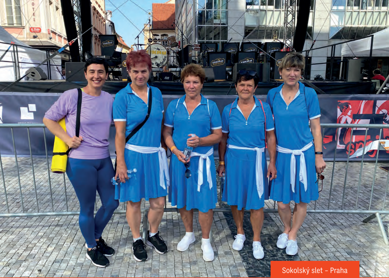
Sokolský slet – Praha