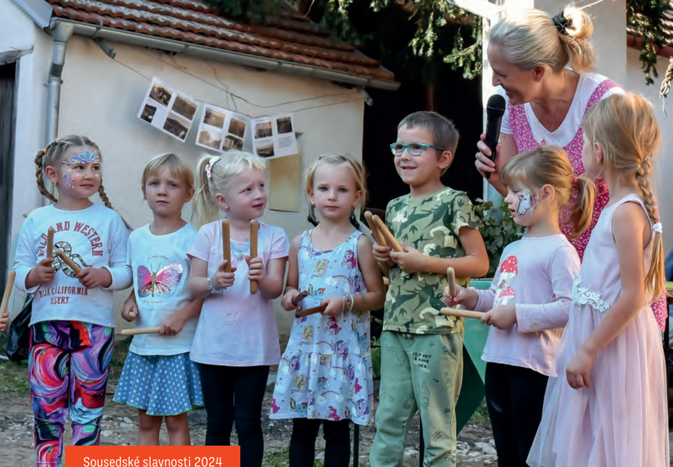
Sousedské slavnosti 2024