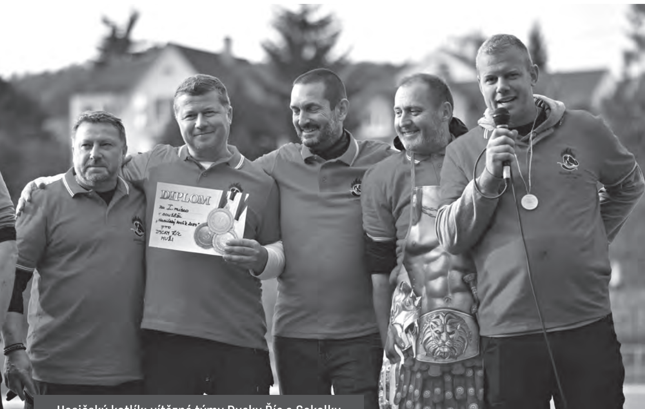
Hasičský kotlík: vítězné týmy Dycky Říc a Sokolky