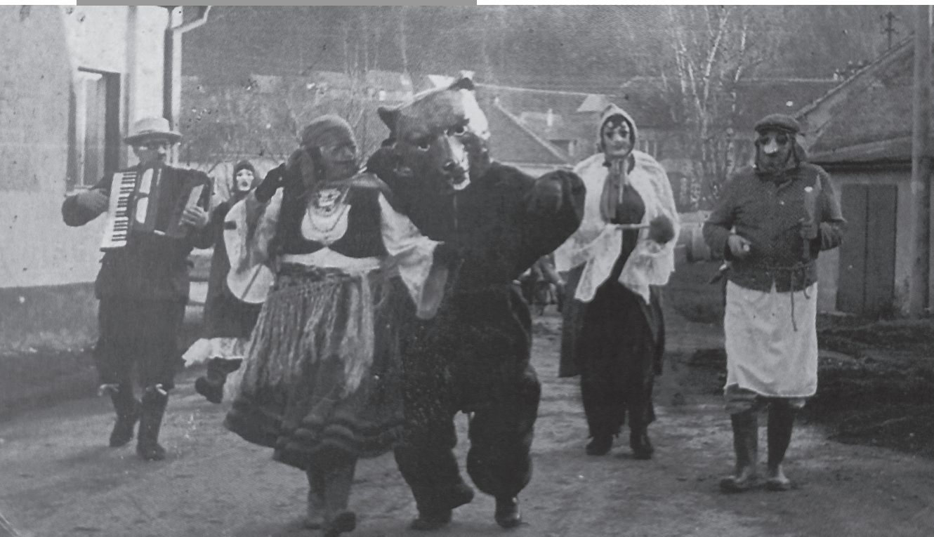
Snímek z Ostatkové pochůzky, kolem r. 1965