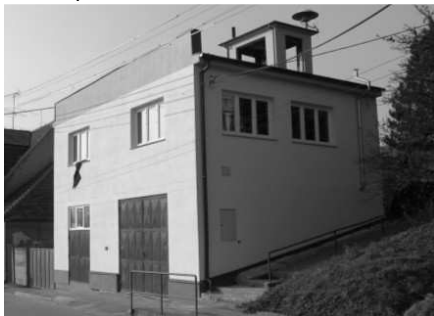
Stav po rekonstrukci 2010

a ve společenské místnosti rozvedla zásuvky na pozdější připojení přímotopů místo nevyhovujících akumulárních kamen.