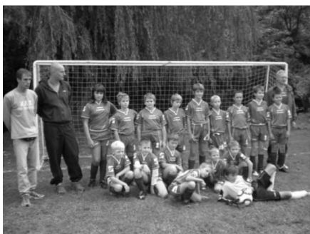
Nově sestavené družstvo mladších žáků před prvním zápasem doma s Lelekovicemi.

Po několika letech máme v Řícmanicích opět mládežnický fotbal. Vedení SK se podařilo dát dohromady hráče z Řícmanic, Bílovic, Kanic a později se připojili také z Babic. Již v polovině července jsme začali trénovat a seznamovat se cca s 15-ti kluky (a jednou holkou) a koncem srpna jsme vstoupili do mistrovské soutěže mladších žáků. Během necelého měsíce se naše řady rozrostly na 26 hráčů (5 z Bílovic, 4 z Kanic, 2 z Babic a 15 z Řícmanic). V zápasech této věkové kategorie se hraje na zkráceném hřišti na menší branky s počtem hráčů 7 + brankář a s „hokejovým způsobem“ střídání. Vzhledem k tomu, že nebylo možné, aby se takový počet hráčů v jednom zápase vystřídal, dospěli jsme k rozhodnutí vytvořit dvě družstva – ročníky 1998 a 1999 nechat v soutěži mladších žáků (12 hráčů) a ročníky 2000 a mladší (14 hráčů) přihlásit do soutěže starší přípravky (měli jsme štěstí, protože v této soutěži byl lichý počet účastníků a mohli jsme se tedy připojit).