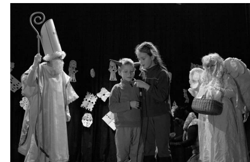
Mikulášská nadílka v sále restaurace.

Přejeme všem našim členům, příznivcům a občanům Řícmanic klidné Vánoce a úspěšný rok 2011.