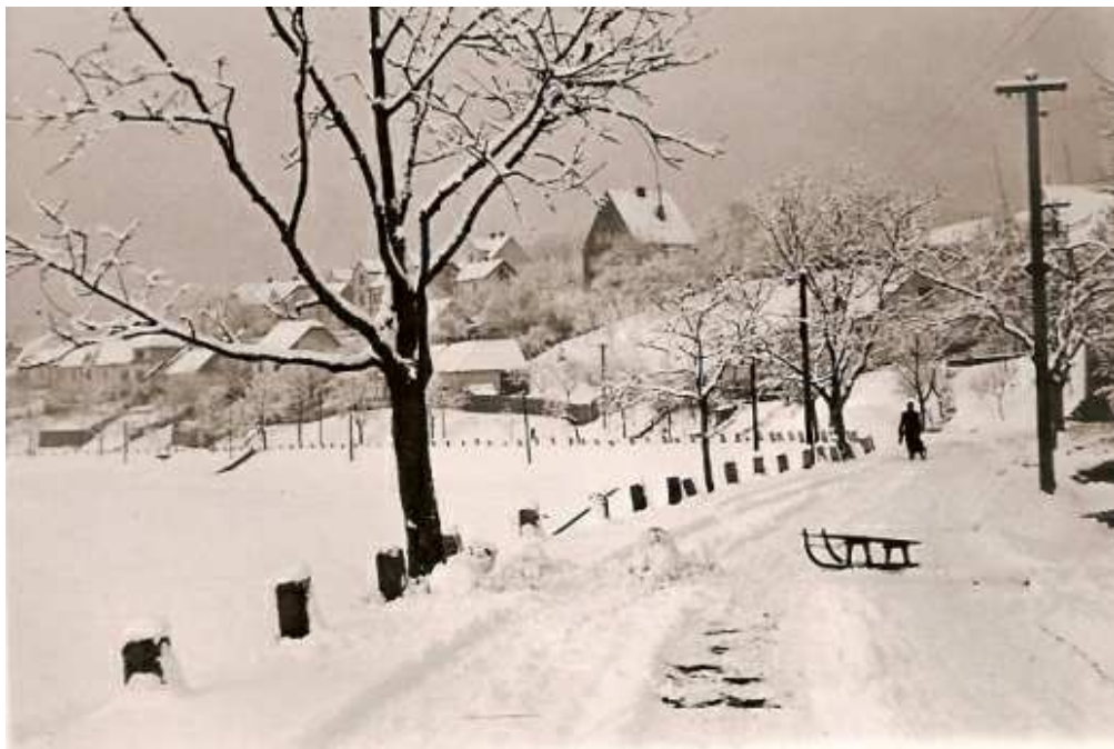
Cesta ke Kanicím (60. léta)