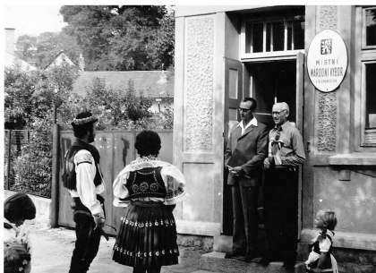
Předávání hodového práva, 1978.