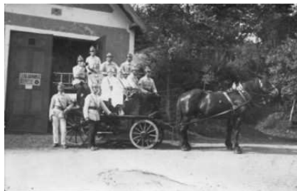
Původní zbrojnice z r. 1921